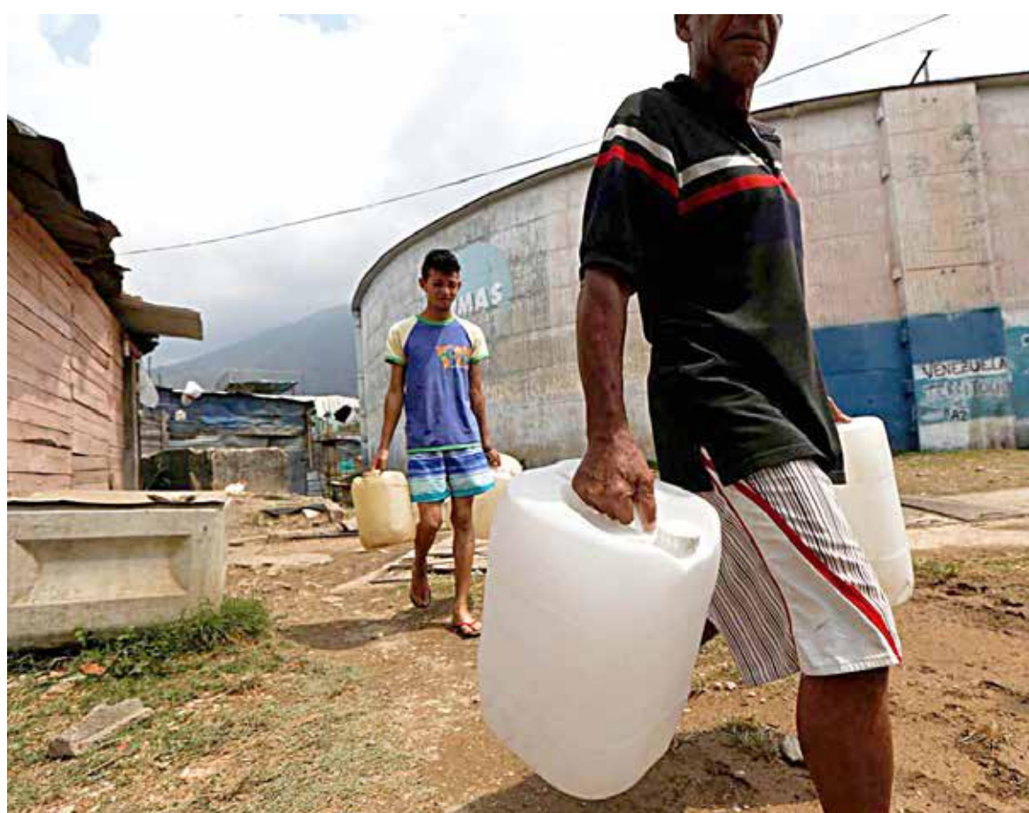
Hay comunidades en Bolívar que llevan décadas sin recibir servicio por tubería y dependen de los pozos o tanques de otras zonas

Cotejo.info logró contabilizar al menos nueve comunidades del municipio Caroní, el principal municipio del estado Bolívar, con escaso despacho de agua potable. Entre las afectadas están los urbanismos: Inés Romero,